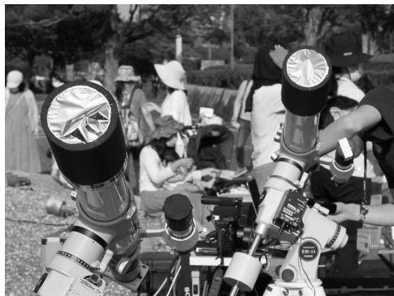
写真2 手作りの遮光板

また、例年どおりポップコーンを作る予定である。前回のサロンではホットケーキや匂いで楽しめるようなもの(カルメ焼きなど)も候補として挙げられた。